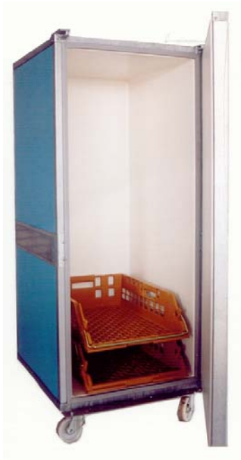
Rolcontainer type Broban