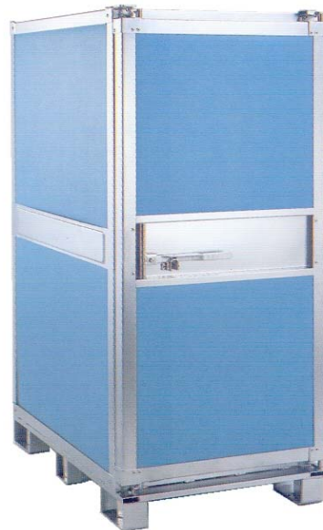
Palletcontainer type 1000/1275