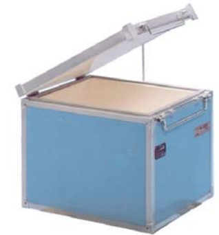
Box container type 180/250