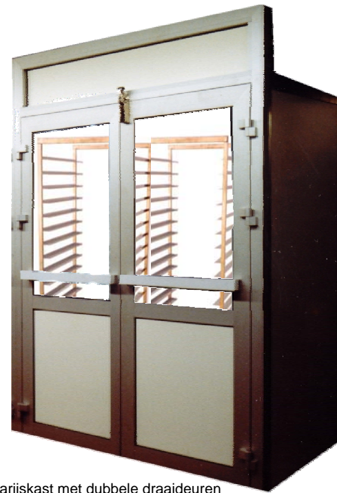
Narijskast met dubbele draaideuren

Bel ons gerust voor informatie of een afspraak (0548) 610523 of kijk op: www.gerbenhekman.nl